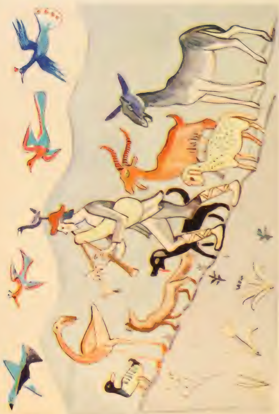
ער הדעם מיט וויין דודע און פילט ניט זיינע טריט.